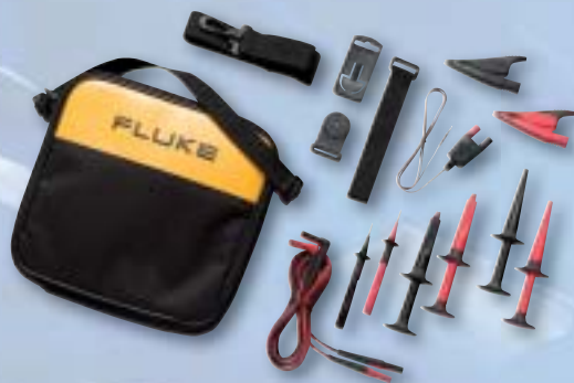
TLK289 Kit de cables de prueba industrial

Tiene a su disposición una amplia gama de accesorios para ayudarle a maximizar la productividad del Fluke 289 y Fluke 287, aunque los siguientes accesorios son esenciales para la mayoría de usuarios.