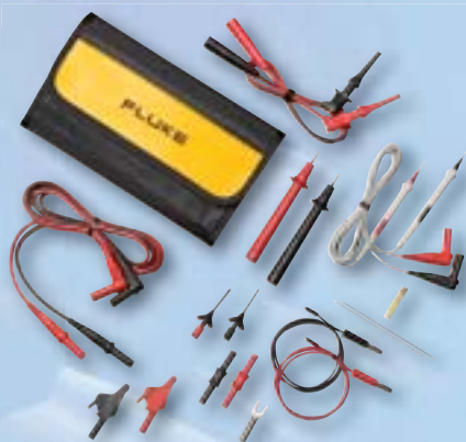
TLK287 Juego de cables de prueba para aplicaciones electrónicas