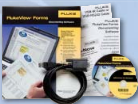
Software FlukeView® Forms y cable