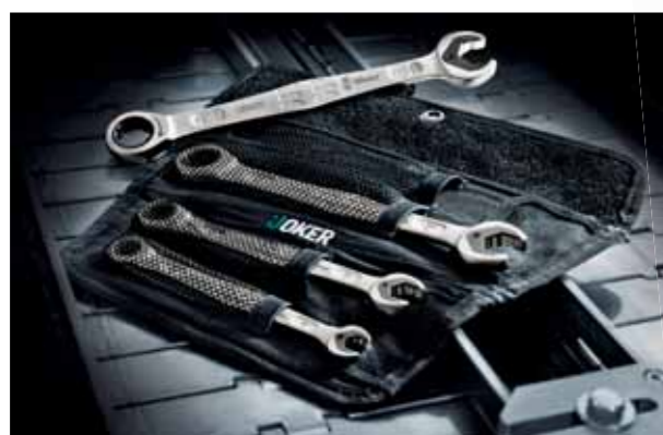
Das Joker Vierer-Set in der praktischen Werkzeutasche.

In nahezu jeder denkbaren Situation löst der Joker Schraubaufgaben in hoher Geschwindigkeit und mit hoher Präzision. Seine Ratschenmechanik auf der Ringseite weist eine außergewöhnlich hohe Feinverzahnung mit 80 Zähnen auf und sorgt für Flexibilität auch in engen Bauräumen. Die spezielle Schmiedegeometrie in Kombination mit hochwertigem Chrom-Molybdän-Stahl und Nickel-Chrom-Beschichtung lässt Sie dreifach punkten: Sehr lange Lebensdauer, hohe Verschleißfestigkeit und nachhaltig hoher Korrosionsschutz.