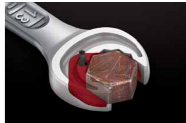
Risikoen for at nøglen glider af forhindres, og dette fører til færre kvæstelser.