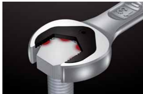
Holdet sørger for, at arbejdet kan klares hurtigere.