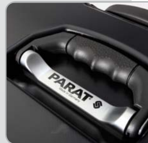
Ergonomischer Griff im Deckel versenkt