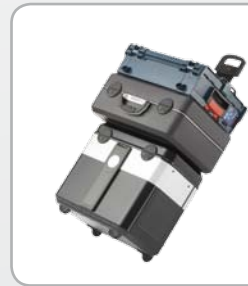
Transport zusätzlicher Koffer