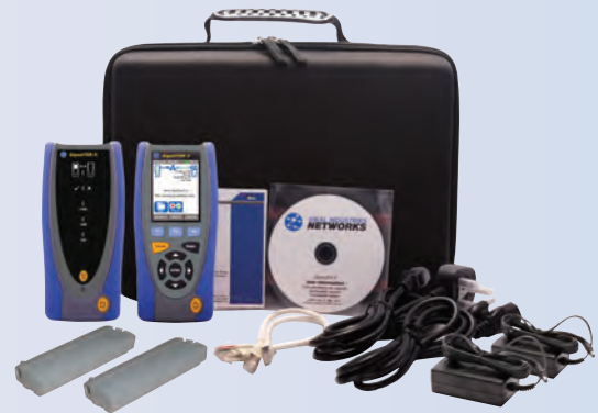
SignalTEK II FO

SignalTEK II è disponibile in due modelli con specifiche in grado di soddisfare le esigenze di tutti gli utenti