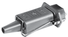
Sicherungsbügel Auszugssicherung für Kabelstecker