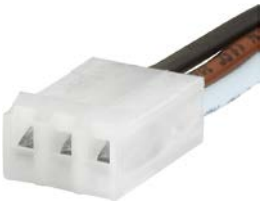
Kabelkonfektionierung Kabelbaum für SCHURTER-Produkte