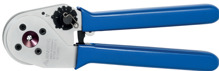
Art. No. 8758 0000 6