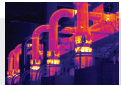
MultiSharp™-Fokus bei der Ti450.