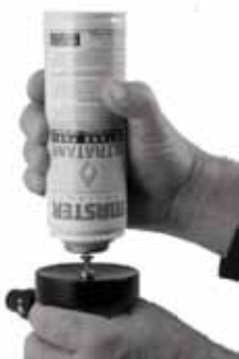
EL MICROSOPLATE MT-30 NO CONTIENE GAS BUTANO EN EL MOMENTO DE ADQUIRIRLO.