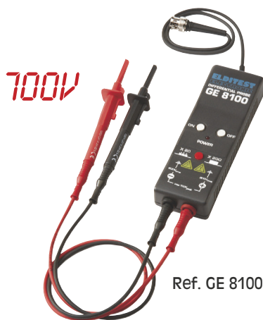
Ref. GE 8100