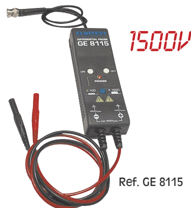
Ref. GE 8115