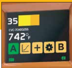
Le manche est équipé d'une LED qui indique à l'opérateur quand le joint est formé.