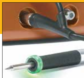
Le manche est équipé d'une LED qui indique à l'opérateur quand le joint est formé.