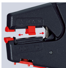
12 40 200 Stillbart lengdeanslag