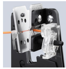
Hassas bıçak profilleri sayesinde tam şekilli izolasyon sıyırma işlemi

Teknik değişiklikler ve yanlışlıklar hakkı saklıdır