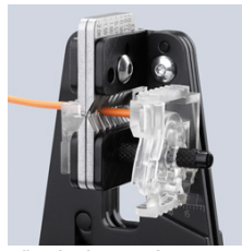
Tüm izolasyon boyunca temiz bir kesim