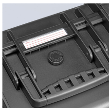
Avec soupape de refoulement pour la ventilation et la plaque signalétique