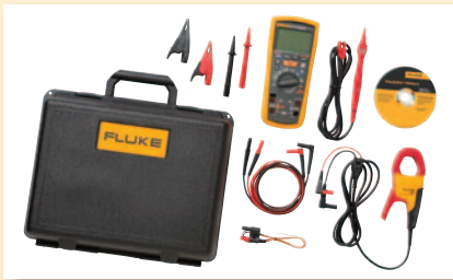
Kit de dépannage électrique avancé Fluke 1587 FC ET