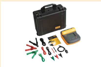
Kit de contrôleur de résistance d'isolement Fluke 1555