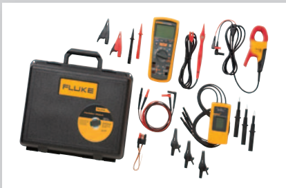
Kit de dépannage de moteur et de variateur avancé MDT