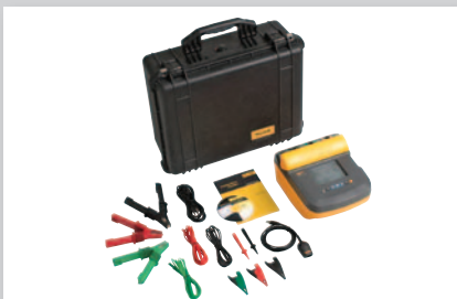
Kit de contrôleur de résistance d'isolement Fluke 1550C