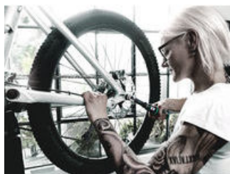
Click-Torque A 6