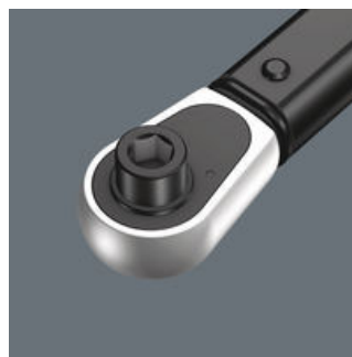
Cliquet 1/4" 6 pans.

Pour nous, le travail avec une clé dynamométrique doit être simple et précis. C'est pourquoi nous avons développé la clé dynamométrique Click-Torque. La simplicité du réglage, la sécurisation de la valeur et la robustesse font de ces clés dynamométriques l'outil idéal pour tous les cas nécessitant un serrage contrôlé.