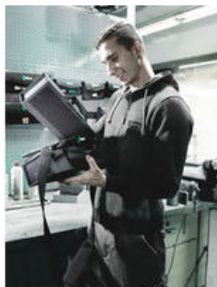
Wera 2go 1 – Il ne lâche rien!

Système de transport d'outils à scratch Wera 2go Pour fixer les trousseaux et pochettes textiles Wera dotées de scratch Grande flexibilité pour une meilleure mobilité Les mains sont libres lors de vos déplacements Bandoulière amovible et réglable avec large coussin