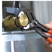
Schnelle und passgenaue Einstellung direkt am Werkstück