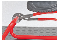
Gegen die Drehrichtung versetzte Zähne bewirken einen Selbstklemmeffekt und verhindern das Abrutschen am Werkstück.