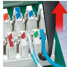
Mit integriertem Ziehaken