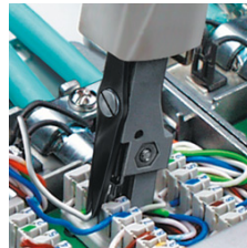
Eindrücken und Abschneiden des Kabels in einem Arbeitsgang