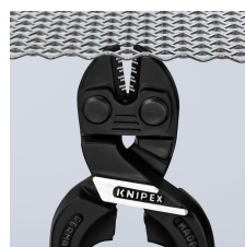
Slankt hoved for optimal adgang