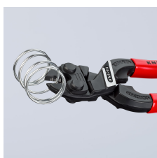
Stor ydelse helt ud i spidserne