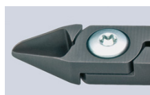
articolazione a vite

Con riserva di modifiche tecniche e salvo errori