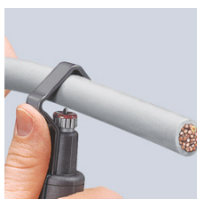
Przystawianie narzędzia do cięcia po obwodzie