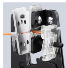
dezizolare prin apăsare și blocare pe forma piesei datorită profilelor precise ale cuțitelor

Ne rezervăm dreptul asupra modificărilor tehnice și posibilelor erori.