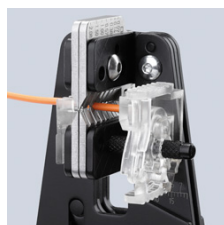
tăierea fără reziduuri a izolației pe întreg perimetrul acesteia