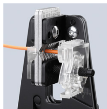
Perfekt inskärning av isolationen längs hela periferin