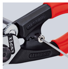
Påpressning av ändhylsor på bowdenhölje