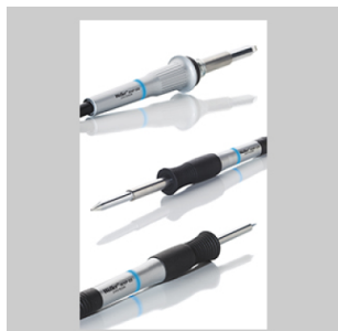
Fers à souder