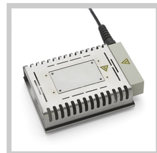
Platines de préchauffage