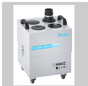
Dispositifs d'aspiration des fumées de soudage