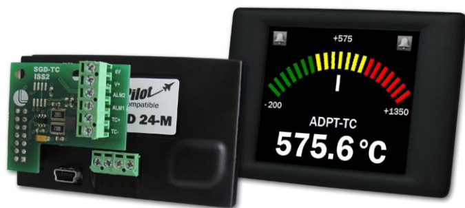
SGD 24-M no incluido

Displays compatibles con PanelPilot: véase PanelPilot.com SGD 24-M SGD 28-M SGD 35-M