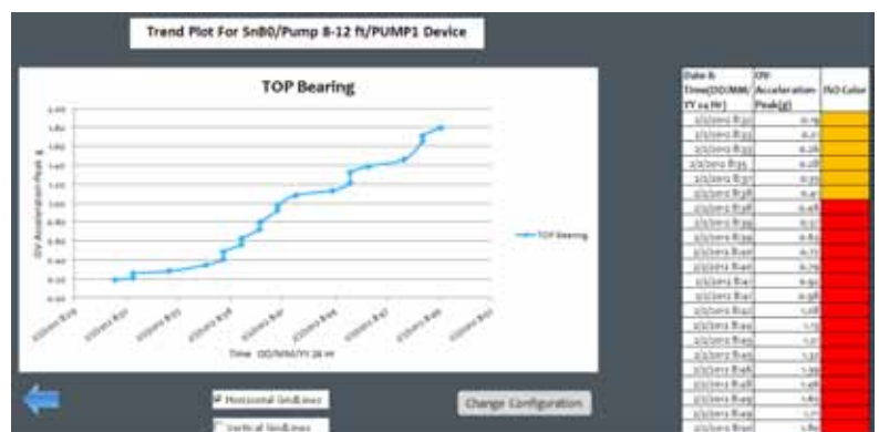
Exemple de graphique de tendance avec le modèle de suivi de tendance du Fluke 805.

Si les mesures prises lors de la tournée de l'opérateur peuvent facilement être importées dans un fichier Excel, alors la tendance des valeurs permettra d'identifier les éventuelles anomalies. L'utilisateur a alors une vision claire des modifications de l'état d'un roulement et de la détérioration de la machine.