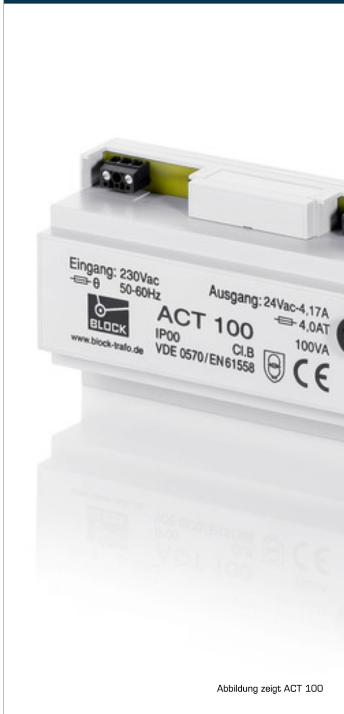
Abbildung zeigt ACT 100