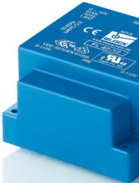
Abbildung zeigt FL 42/12