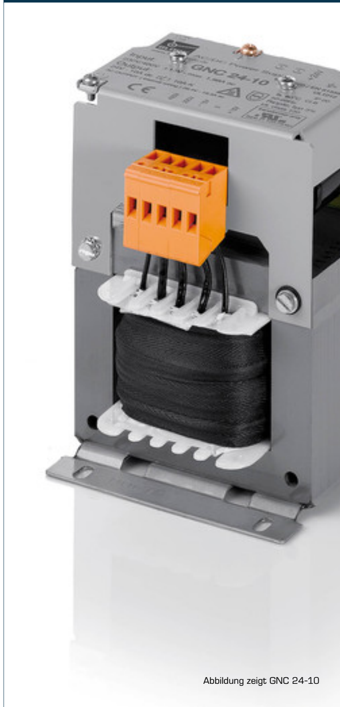
Abbildung zeigt GNC 24-10