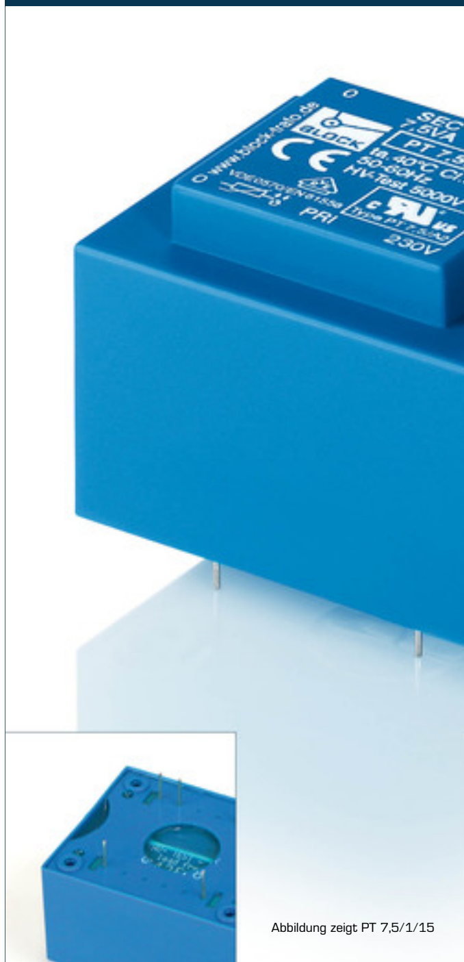
Abbildung zeigt PT 7,5/1/15