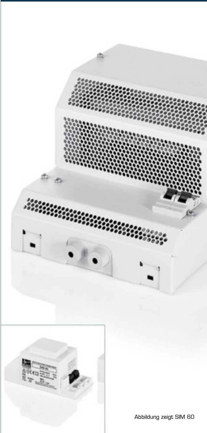
Abbildung zeigt SIM 60