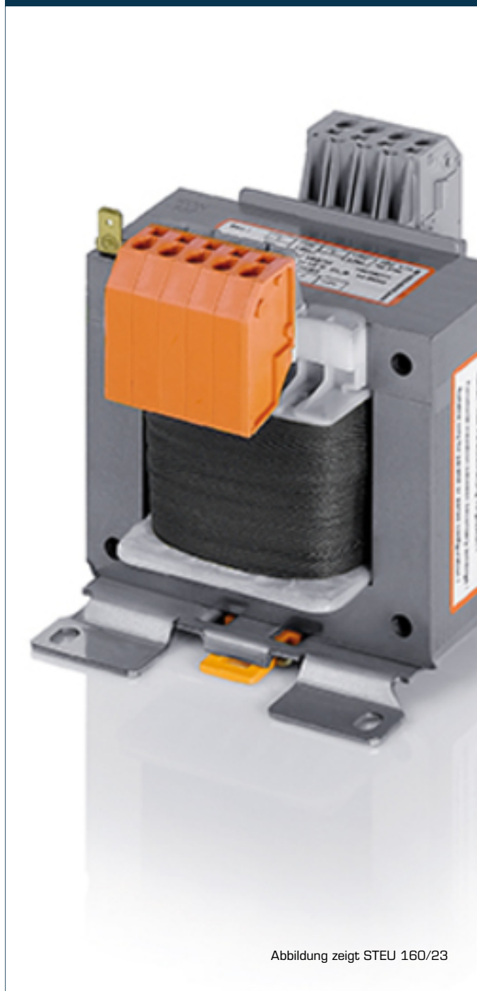
Abbildung zeigt STEU 160/23