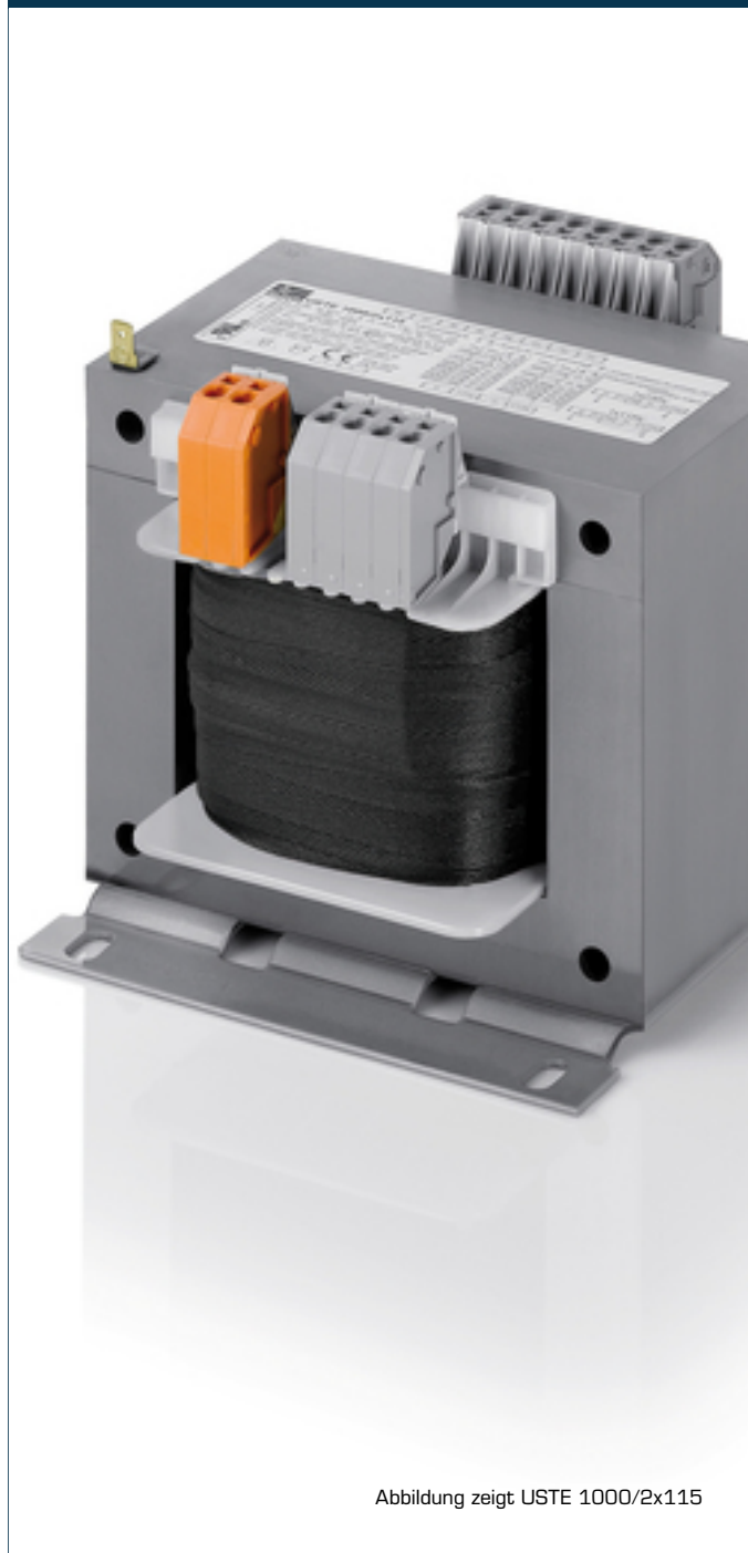
Abbildung zeigt USTE 1000/2x115