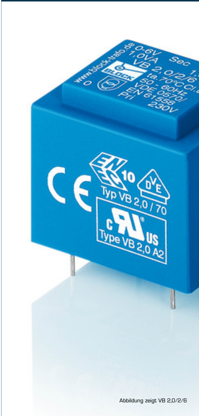
Abbildung zeigt VB 2,0/2/6