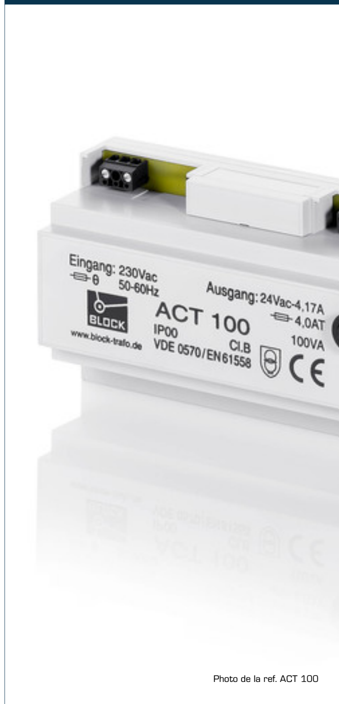
Photo de la ref. ACT 100