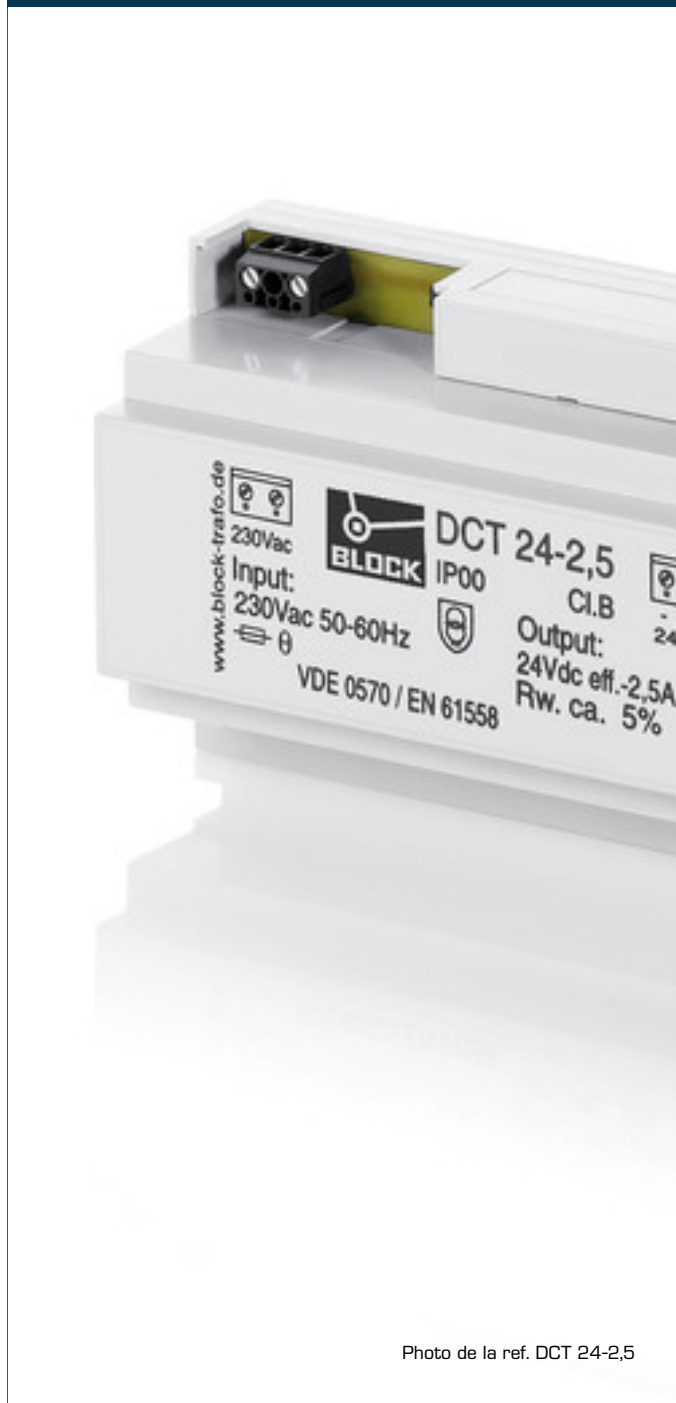
Photo de la ref. DCT 24-2,5