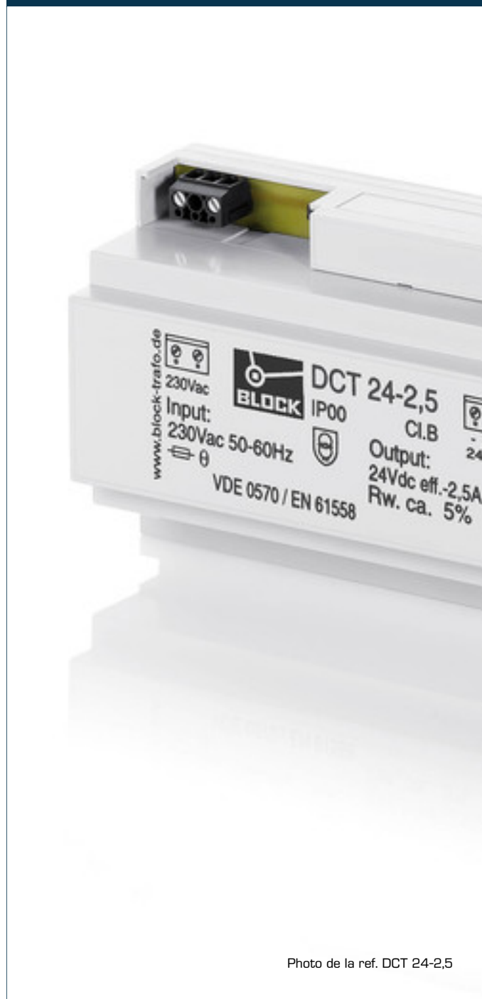
Photo de la ref. DCT 24-2,5