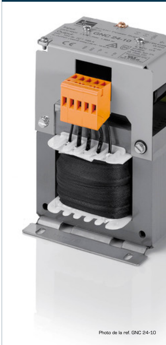
Photo de la ref. GNC 24-10