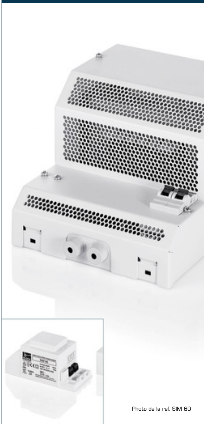
Photo de la ref. SIM 60