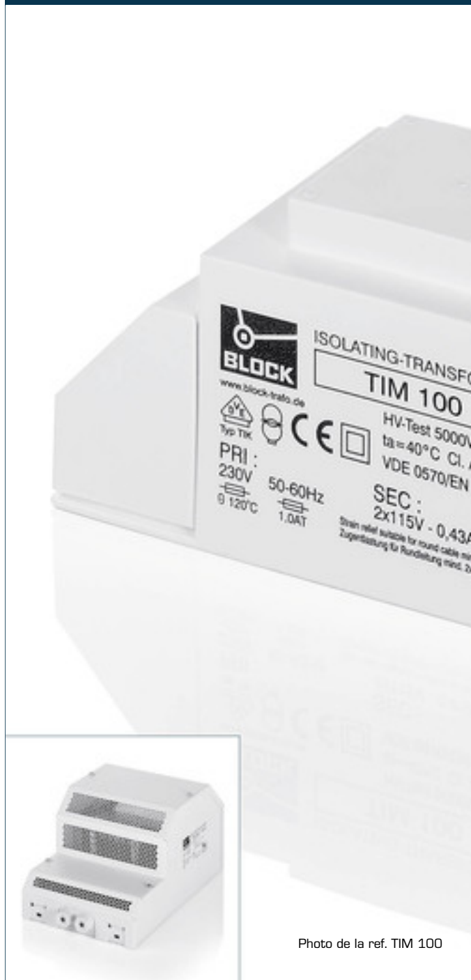
Photo de la ref. TIM 100