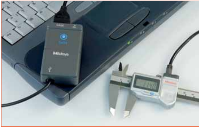
Réf. 264-014-10 Connecteur USB

Interface via le buffer/clavier pour l'intégration des données Digimatic dans les programmes.