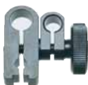
Réf. 900321 Noix de serrage