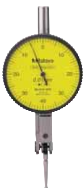
Réf. 513-404 E Comparateur à palpeur orientable