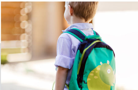
KÖZÖSSÉG ÉS OKTATÁS