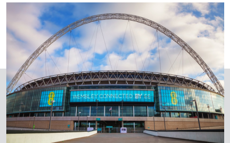
SPORT ÉS SZABADIDŐ

Védje az embereket a potenciális koronavírus hordozóktól és más fertőző betegséggel megfertőződött emberektől. A VIRALERT 3 belépéskor ellenőrzi a látogatók megemelkedett hőmérsékletét, amely lázra utalhat.