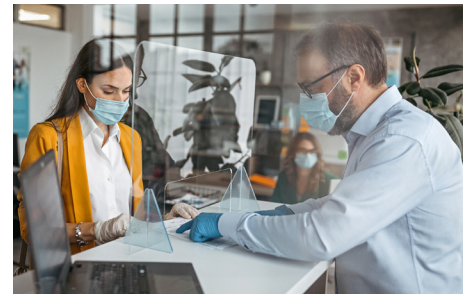
IRODA ÉS GYÁRTÁS