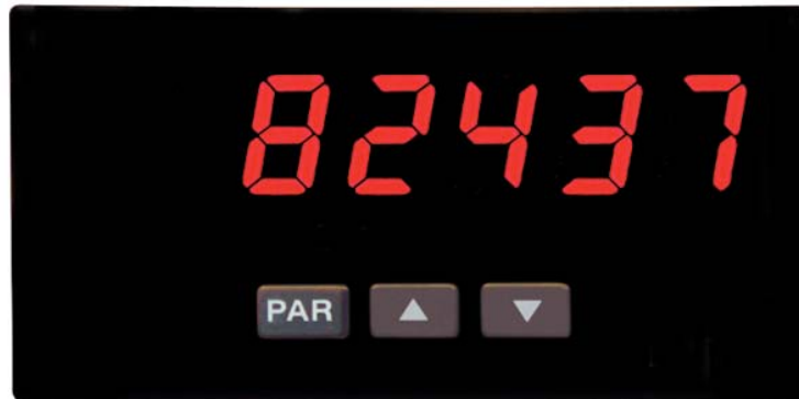
PAX LC in Originalgröße

Der Industrie - Zähler PAX LC kann natürlich auch als sehr flexibles und genaues Laborgerät eingesetzt werden. Er wurde aber mit dem robusten Kunststoffgehäuse und der hohen Schutzart IP 65 für den rauen Industrieinsatz konzipiert. Die weltweit eingesetzte, ausgereifte und auf Langlebigkeit ausgelegte Elektronik erhält vor Auslieferung einen 3 Tage langen Qualitätstest unter Vollast. Das Gerät wird direkt über 3 Tasten schnell und sicher projektiert.