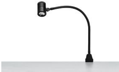
SPOT LED 003 - MCTFL 3 N

tensione di alimentazione equipaggiamento alimentatore cavo d'alimentazione corpo dell'apparecchio materiali superficie bracci dell'apparecchio materiali peso (netto) fissaggio