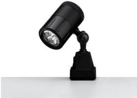
SPOT LED 003 - MCXFL 3 S