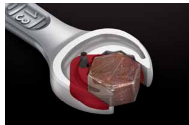
Riduce il rischio che la chiave scivoli evitando infortuni.